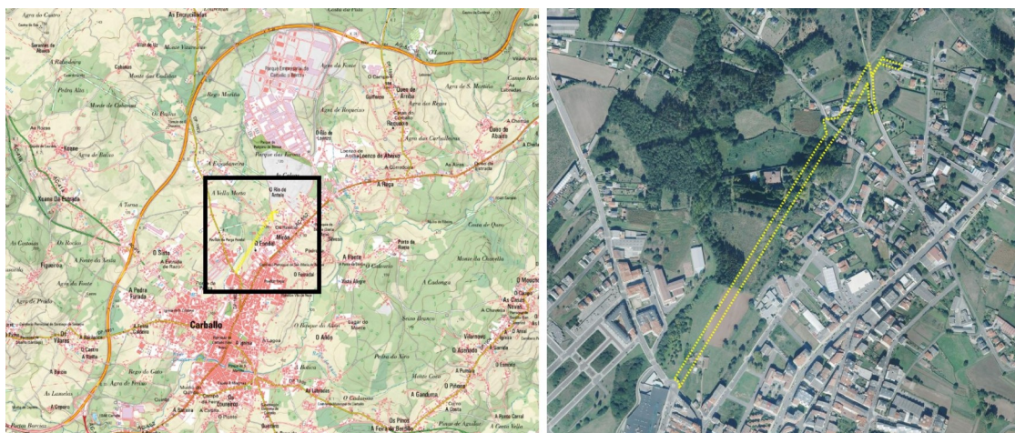
Emprazamento do ámbito do PEID