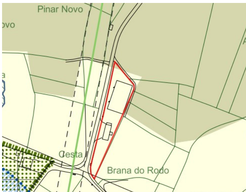
Fragmento do plano de clasificación do solo e sistemas xerais do PXOM modificado.

apertura dun Centro Docente Específico de Educación Especial. Mantense a clasificación urbanística dos terreos como solo rústico de especial protección agropecuaria.