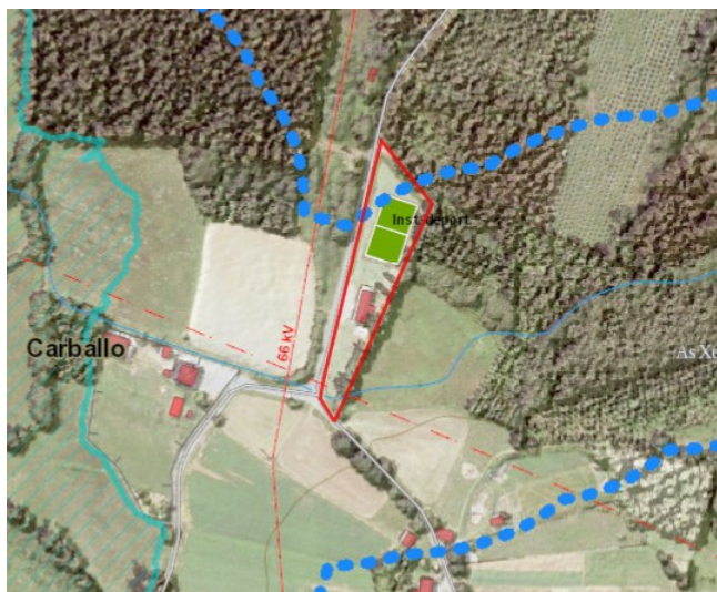
Ámbito da MP sobre imaxe do visor do PBA coa afección de AUGAS

O ámbito de actuación da MP está na zona de na zona de policía de canles dun rego sen nome afluente do o Río Grande (14901911). A planificación non prevé a implantación de novos usos edificables polo que se pode afirmar que a súa aplicación non xera efectos significativos sobre o ciclo hídrico.