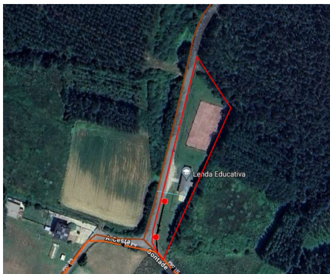
Estado actual dos terreos do ámbito da MP e a súa contorna. Servizos urbanísticos.

A contorna componse de terreos de uso forestal con coníferas, matogueira, cultivos herbáceos e prados, tamén localízanse algunhas vivendas unifamiliares. A parcela que constitúe o ámbito da MP dispón de servizos urbanísticos de abastecemento de auga potable, saneamento de augas residuais, rede de enerxía eléctrica e telecomunicacións.