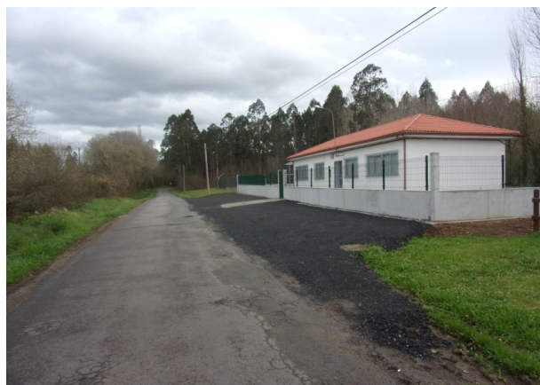
Vista do ámbito da MP desde o sur