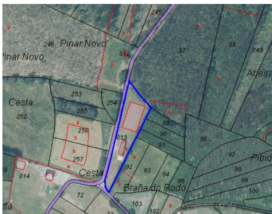
Ámbito da MP sobre cartografía do catastro